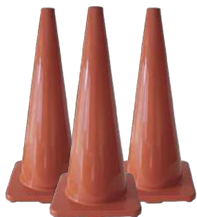
COD. #10802004 Conos 12"-18"-28"-36"