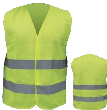
COD. #10803005 Chaleco amarillo doble reflectivo