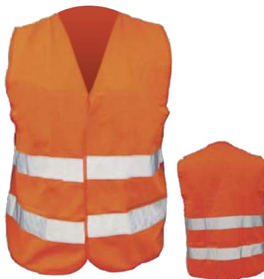
COD. #10803002 Chaleco reflectivo doble