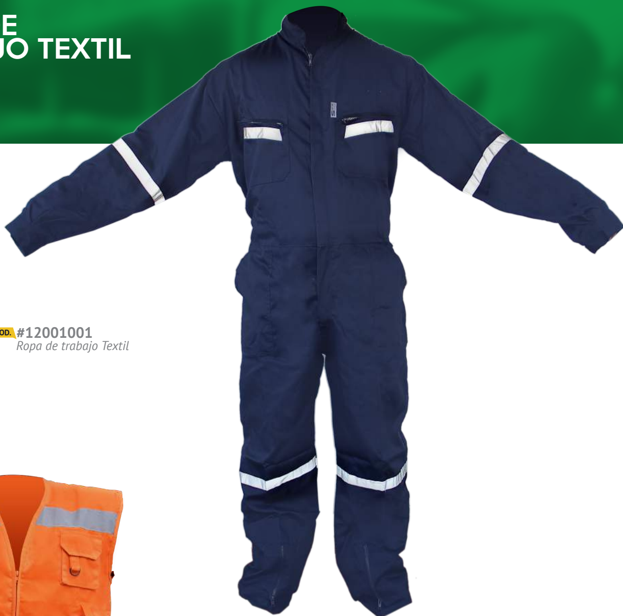
COD. #12001001 Ropa de trabajo Textil