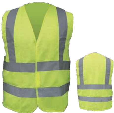
COD. #10803004 Chaleco amarillo reflectivo tipo H