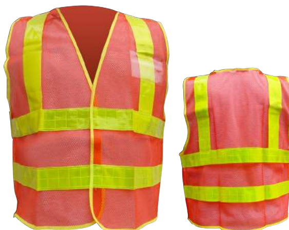
COD. #010803008 Chaleco reflectivo mixto