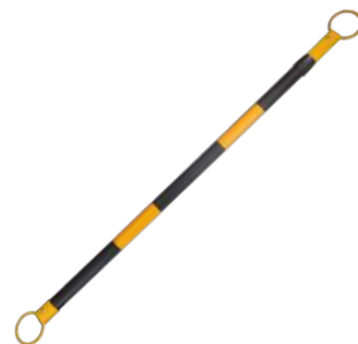
COD. #10802003 Barra retráctil para conos ajustable hasta 218cm.