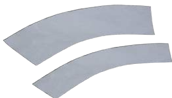
COD. #20201003 Cinta reflectiva para conos