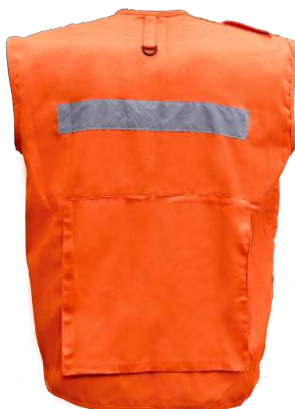
COD. #12002006 / 12002008 Gabardina y Poplín