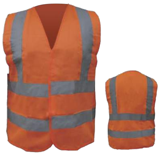
COD. #10803001 Chaleco reflectivo tipo H