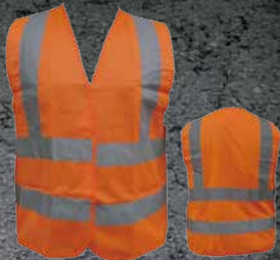
10803003 Chaleco Reflectivo Mixto