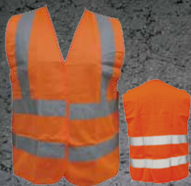
10803001 Chaleco Reflectivo Tipo H