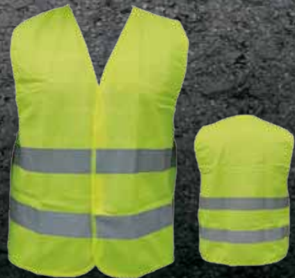
10803005 Chaleco Reflectivo Amarillo Doble