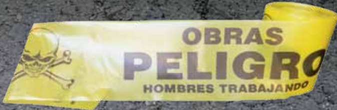
10804001 5" Pulgadas x 100 Metros