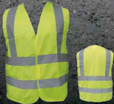
10803004 Chaleco Reflectivo Amarillo Tipo H