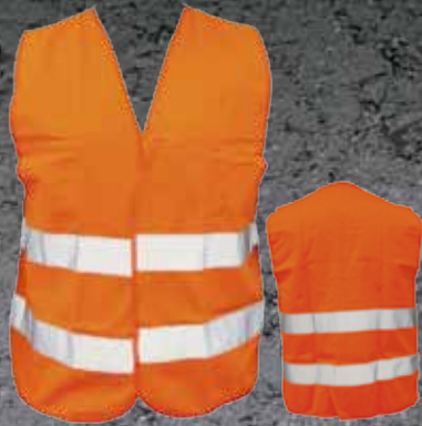
10803002 Chaleco Reflectivo Doble