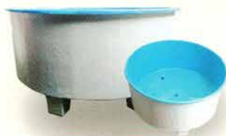
Tanques para acuicultura

De grandes dimensiones, para especies de mayor tamaño.