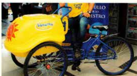
Triciclo de helados