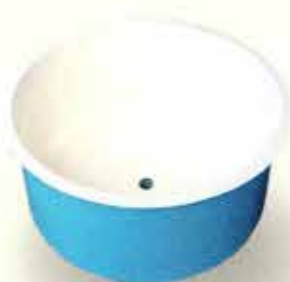
Tanques para acuicultura